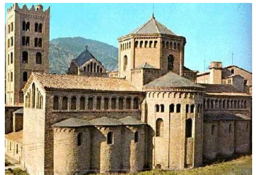
Disponível em: https://userscontent2.emaze.com/images/84bcfb7c-6f84-428c-bb27-42037026b97b/34b9ec21-8b3a-488e-be06-16c903c0d419.jpg . Acesso em 19/10/2016