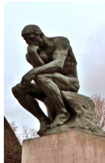
"O pensador", Auguste Rodin. https://joaquinmery.files.wordpress.com/2010/12/imga0003_3.jpg?w=168&h=300 . Acesso em 19/10/2016

22. O Suprematismo foi um movimento artístico do início do século XX inspirado nas ideias do Futurismo e do Cubismo. Kasimir Malevich (1878-1935) é um de seus principais representantes. Observe a imagem a seguir e marque a opção CORRETA.