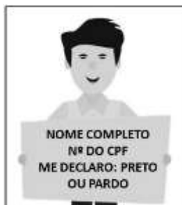
Figura 3. Modelo de Autodeclaração para o vídeo.