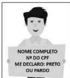
Figura 3. Modelo de Autodeclaração para o vídeo.